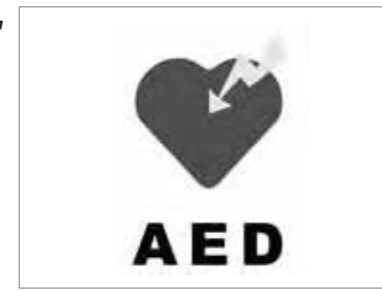
AED 訓練 (自動体外式除細動器)

心臓に電気ショックを与え再び正常な状態に戻します。ふたを開けるか電源ボタンを押すと機器が音声で使用方法を指示してくれます。電気ショックが必要ない場合にはボタンを押しても通電されません。