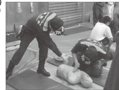
心臓マッサージ (胸骨圧迫)

大きな声で話しかけても反応がなく普段通りの呼吸がなければ心臓マッサージが必要です。周りに人がいる場合は近くの人に協力を依頼しましょう。